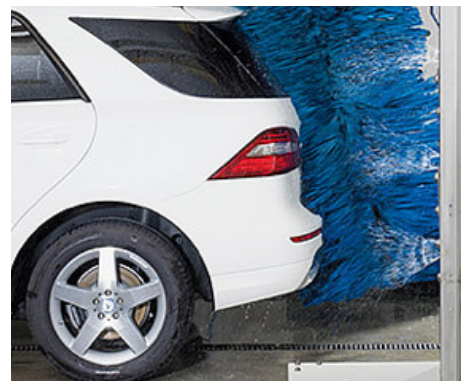
Täydellinen auton muodon seuranta

Voit myydä ominaisuuden pesuun lisähinnalla, tehdä omat maasturipesut tai ottaa ominaisuus käyttöön vain kalliimmissa pesuohjelmissa. Saat tyytyväisempiä asiakkaita ja parempaa keskihintaa.